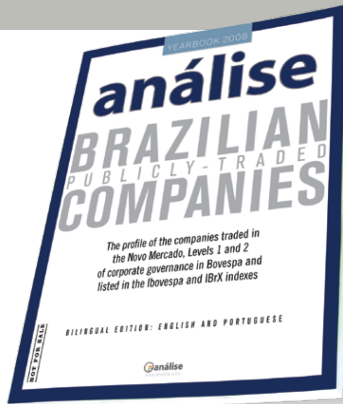
▲ Versão com capa em inglês

EM SEUS ROAD SHOWS, AS EMPRESAS E OS PROFISSIONAIS DE RI ACABAM DEIXANDO DE FALAR COM MUITOS INVESTIDORES ESTRANGEIROS. O ANUÁRIO CONSEGUE ATINGIR 7.500 TOMADORES DE DECISÃO NO EXTERIOR E FICAR EM SUAS MESAS DURANTE UM ANO.