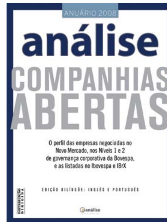
▼ Versão com capa em português

Todas as empresas com grau de governança diferenciada na Bovespa ou que integram o índice IBRX (num total de 179 companhias pelos dois critérios) recebem uma página inteira onde se listam 258 informações que ajudam o investidor a compreender o funcionamento de cada uma delas.