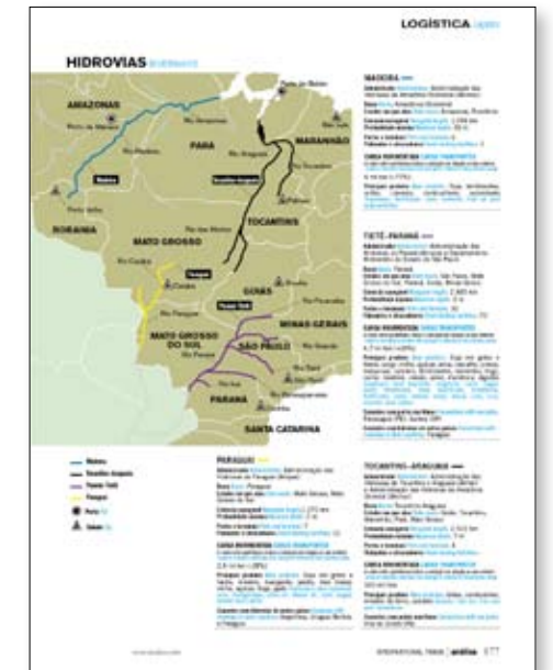
▲ Exemplo de uma página da edição 2008