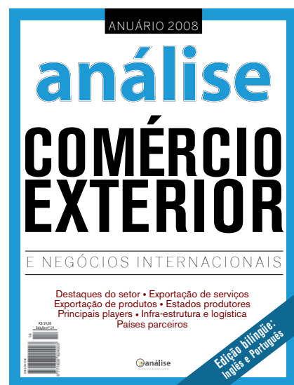
▲ Versão com capa em português

40mil Dados sobre as trocas comerciais do Brasil com o mundo